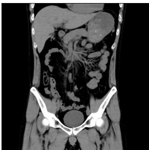
上・下腹部 冠状断